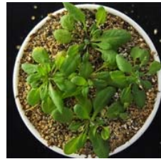
water stress-tolerance (mutant)