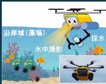
マリンドローンを用いた藻場調査