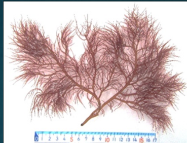
県南での新たな藻類養殖の創出