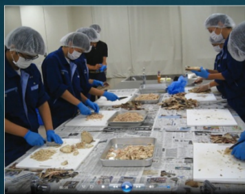
ミリソウで育てたメガイアワビ