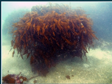
徳島県が開発した単体藻場礁