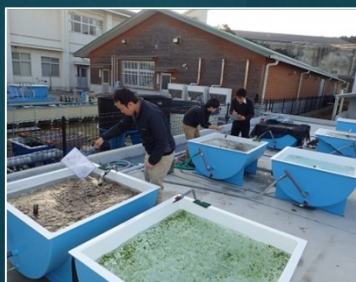
ヒトエグサの陸上養殖