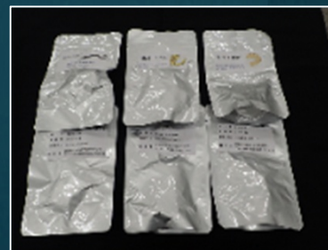
科技校生による水産加工品の試作