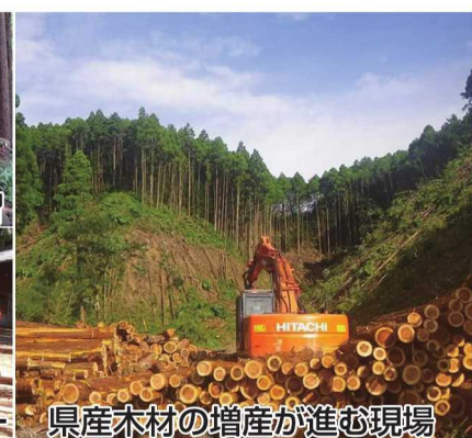
県産木材の増産が進む現場