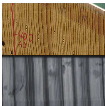
環境変動等が記録された年輪・年縞

樹木の年輪は、過去の環境変動の天然の記録計です。また、年輪の変動パターンを利用して、古建築物や仏像といった文化財の年代を決定することができます。こうした「年輪年代学」の研究成果と、樹木年輪と同様に1年1年の縞をつくる湖沼の堆積物に着目した、高精度な年代測定方法の開発や古環境復元についての研究成果を紹介します。