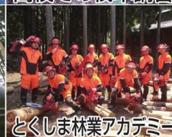
とくしま林業アカデミー