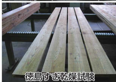
徳島すぎ乾燥試験