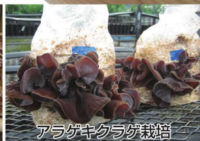
アラゲキクラゲ栽培