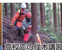
高校での伐木講習