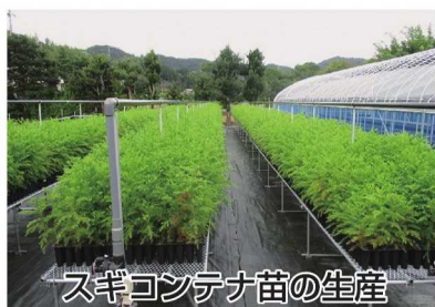
スギコンテナ苗の生産