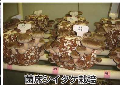
菌床シイタケ栽培