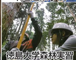
徳島大学森林実習