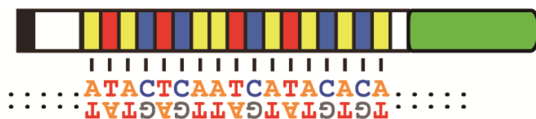
図1 TALE-FP の分子構造